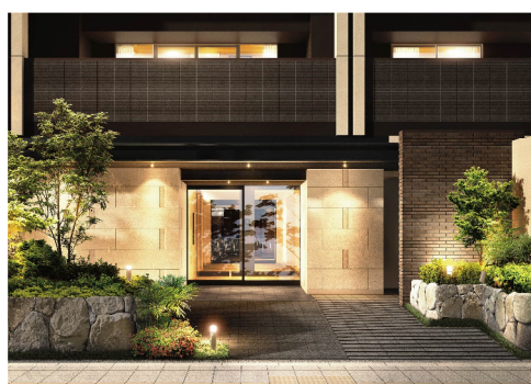
エントランス（イメージ）

本物件は、大分市役所や大分城址公園などが建ち並ぶ昭和通り沿いに位置し、利便性の高い施設が揃うJR「大分」駅までバスで9分の立地です。