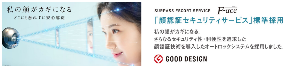
サーパスエスコートサービス+F face （イメージ）

顔認証技術を導入したセキュリティサービス「サーパスエスコートサービス+F face 」を標準採用しています。また、ご家族が帰宅した時や宅配ボックスに荷物が預けられた際には、指定のメールアドレスにメールが配信されます。不在時に訪問者があった際は、訪問者の顔写真付きのメールが配信されるなど、最新のテクノロジーにより安心・便利なライフスタイルをお届けします。