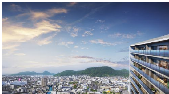
高松市内の眺望（イメージ）

本物件は、上之町エリア内で「サーパス上之町ミッドレジデンス」※に続く2棟目となります。ことでん琴平線「三条駅」徒歩7分、中央通りや塩江街道の幹線道路に囲まれた立地で、市内・郊外へのアクセスが快適です。周辺には、「紫雲山」や特別名勝の「栗林公園」がある落ち着いた住宅街でありながら、県内最大のショッピングモール「ゆめタウン高松」やクリニックなど、生活利便施設が充実しています。