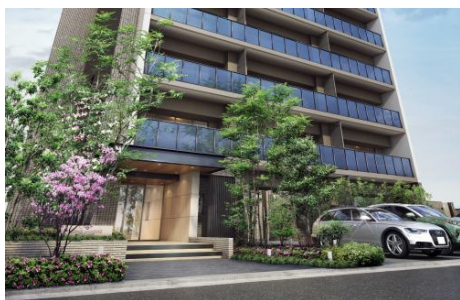
建物南面 (イメージ)

外観デザインは、周囲の景観になじむようグレーを基調とし、南面のバルコニーはブラックガラスで高級感を演出しています。また、エントランスは奥行きを感じられる連続性のあるデザインで、上質で心安らぐ落ち着いた雰囲気を演出します。