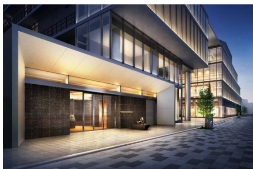
エントランス（イメージ）

また、大京オリジナルの各住戸専用の宅配ボックス「ライオンズマイボックス」を、岡山県で初導入します。住戸数に対する宅配ボックスの設置率は100%を超え、居住者全員がいつでも安心して荷物を受け取ることが可能です。