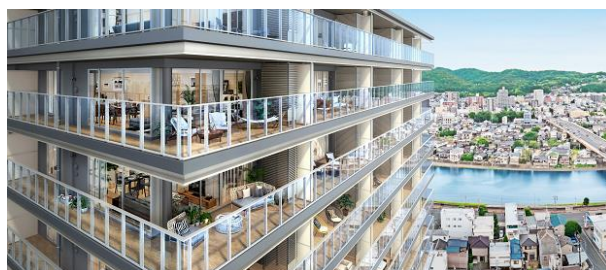
バルコニー（イメージ）

本物件は、岡山市の中心市街地である“都心1kmスクエア”内で建築中の再開発ビル内の9階から20階に位置します。全住戸が地上約38m以上に配置され、視界を遮るものがない開放的な眺望をご覧いただけます。専有面積は55.87㎡～86.42㎡、間取りは2LDK、3LDK、4LDKの全7タイプをそろえ、南向き住戸には、奥行き最大約2.7mの広々としたバルコニーを設置します。建物は「中間免震構造」を採用し、地震時に地面から伝わる揺れを低減します。また、オール電化で光熱費を抑えるとともに、くらしの安心・安全を守ります。