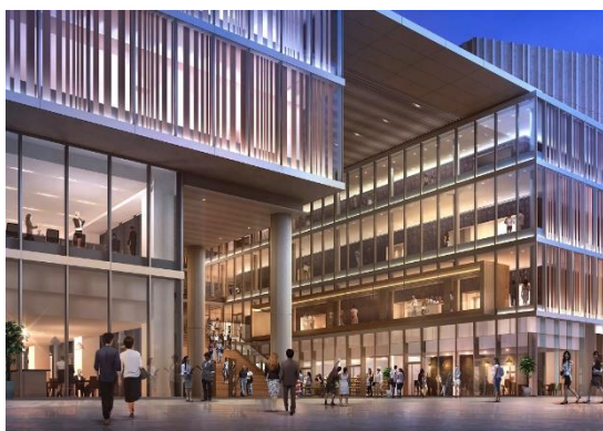
(仮称) 千日前スクエア (イメージ)

本再開発ビルは、ホール棟と事業棟からなる一体的な建物で、事業棟では 1 階は店舗・住宅エントランスとオフィスエントランス、2 階から 4 階は劇場フロア、5 階から 7 階はオフィスフロア、9 階から 20 階が住宅フロアになります。建物 1 階中央には街行く人が自由に出入りでき、劇場のエントランスとなる屋根付きの歩行者空間「(仮称) 千日前スクエア」を計画し、災害時には近隣の方が集まる防災拠点としての運用が予定されています。