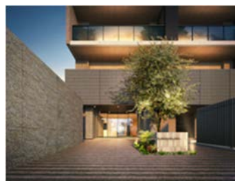
エントランスアプローチ（イメージ）

また、第一種住居地域に面していることで南西側に住宅地の穏やかな街並みが広がり、心地よく抜ける見晴らしを一望できます。