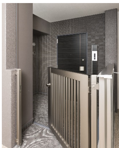
玄関ポーチ (イメージ)