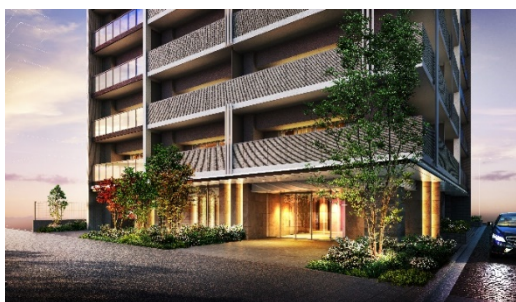
エントランス外観 (イメージ)

アースカラーを基調とした外壁には、バルコニーを仕切るマリオンが交互に連なりアクセントになっています。エントランス部分はダウンライトによる光の演出により、訪れる方々を上質な雰囲気でお迎えします。