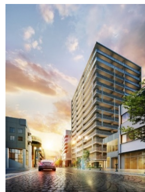
大手前通り沿いの外観イメージ

「サーパス高崎連雀町」は、高崎城正門に続く由緒ある「大手前通り」沿いに位置します。近隣には、老舗百貨店「スズラン百貨店」や、飲食店や美容院、ブティックなど多彩な店が軒を連ねる「大手前慈光通り商店街」など、商業店舗も充実しています。また本物件から約200m先にある高崎城址には、市役所や図書館、音楽ホールなどの文化施設、公園や学校などがあり、生活に必要な施設が身近に備わった住環境です。