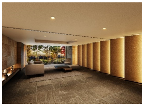
エントランス（イメージ）

「サーパス高崎連雀町」は、JR「高崎」駅および上信電鉄「高崎」駅より徒歩9分、高崎城の正門へ続く大手前通りに隣接する、高崎の中心地である連雀町に位置します。「高崎」駅は、上越新幹線、北陸新幹線をはじめ9路線が乗り入れする主要ターミナルとして、東京駅まで直通50分と都心へのアクセスも良好です。