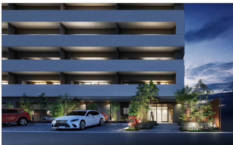
※完成予想図（アプローチ）