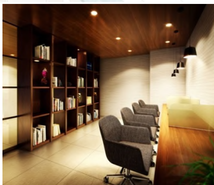
スタディールーム