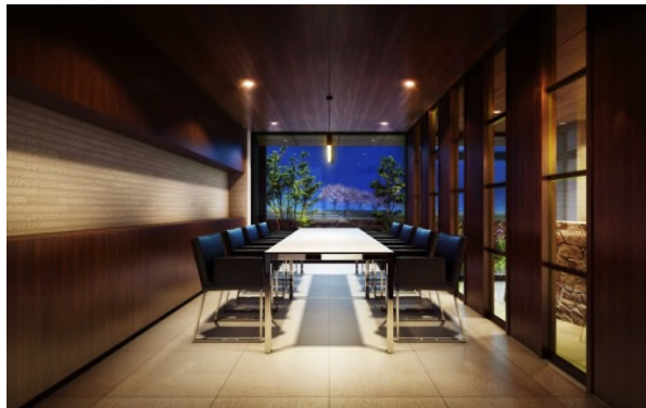
ミーティングルーム