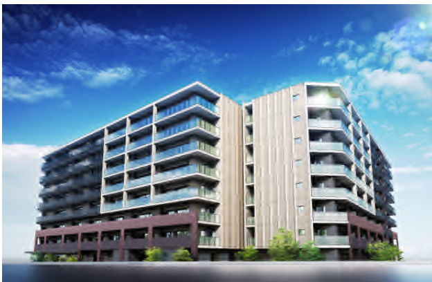
ファサードデザイン

レジデンスに相応しいキャノピーを設えた車寄せのあるエントランスでは、木目調のデザインを生かした柱とダイナミックなキャノピーがお出迎えいたします。また、石積の擁壁にも自然石を採用し、味わい深いテスクチャーで富山らしさと上質さを演出しました。