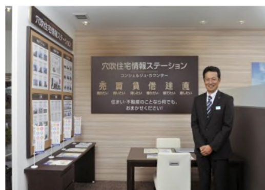
新サービス『住宅情報ステーション』 コンシェルジュ・カウンター