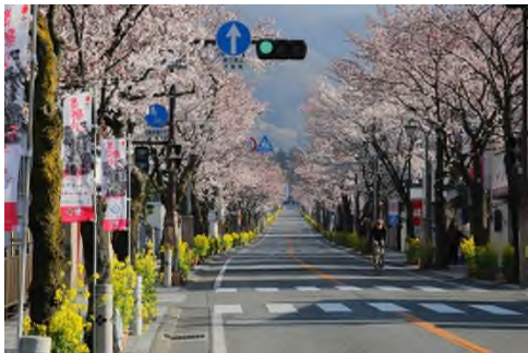
武田通り 徒歩 1 分 (約 60m)

再開発され利便性も充実した甲府駅北口エリアも生活圏です。山梨県立図書館は県内一の蔵書数を誇り、自習や読書のための大型サイレントルームも完備。また、甲州夢小路は小江戸をイメージしたレトロなレストランやカフェ、ギャラリーが建ち並び、まるで明治～昭和初期にタイムスリップしたような感覚で楽しめます。