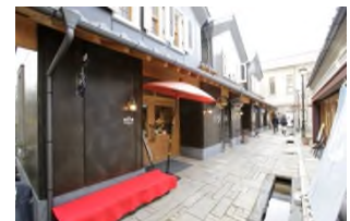
甲州夢小路 徒歩 15 分 (約 1,160m)