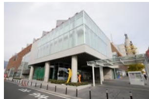
山梨県立図書館 徒歩 11 分 (約 880m)