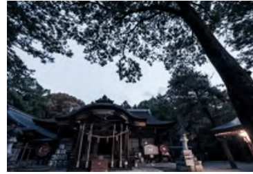
武田神社 徒歩 17 分 (約 1,360m)

「武田」の名の由緒と共に、古くから静かな環境を守り続けている山の手エリア。本物件はその歴史の継承にふさわしい日銀社宅跡地に誕生します。また、山梨大学付属小学校や中学校をはじめとした伝統ある教育施設が充実した文教エリアであり、歴史ある風土にまつまれた生活が送れます。