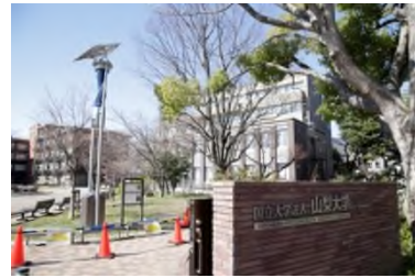
山梨大学 徒歩 6 分 (約 480m)