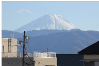
建設地から富士山を望む

緩やかな丘陵地の山の手エリア。「武田」を冠するマンション自体 4 年ぶりの供給となります。周辺には高層建物がいないため、日当たり良好で、世界遺産の富士山や甲府市街も一望できます。