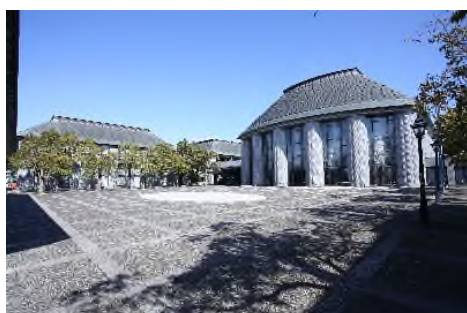
松江市総合文化センター (徒歩 4 分)

「プラバホール」「中央図書館」を擁する松江市総合文化センターも徒歩圏内。市立中央小学校、市立第三中学校が学区であり、文化と教育が密接した子育てファミリーにうれしい住環境です。