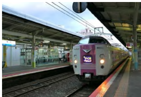
JR 山陰本線「松江」駅徒歩 9 分