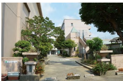
市立中央小学校 (徒歩 8 分)