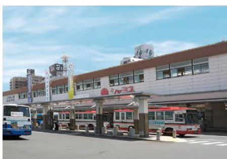
シャミネ松江 (徒歩 9 分)