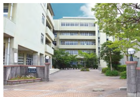
市立第三中学校 (徒歩 3 分)