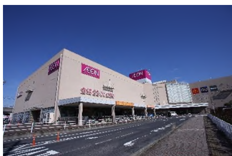
イオン松江店 (徒歩 3 分)

松江市内で最大規模のイオン松江店まで徒歩 3 分。品揃えが豊富で松江市内唯一の映画館「松江東宝 5」も併設しています。また、一畑百貨店、シャミネ松江など徒歩圏内に商業施設が充実しています。