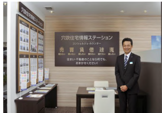
新サービス『住宅情報ステーション』 コンシェルジュ・カウンター