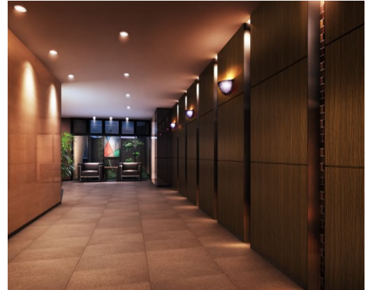
上質のエントランスホール