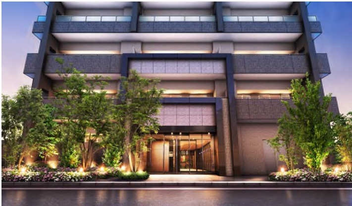
格調高いエントランスファサード

歴史ある街並み邸宅の美意識と誇りを描き、圧倒的な存在感を放つエントランスアプローチ。照国神社の鳥居をイメージさせる堂々とした構えのファサードは、質感豊かな石材やタイルを配し、格調高い表情をデザインします。また家族を迎え入れるエントランスホールには薩摩切子でデザインされたアクセント照明など、伝統と芸術が融合する迎賓の空間を追求しました。