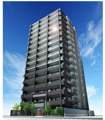
完成予想外観パース