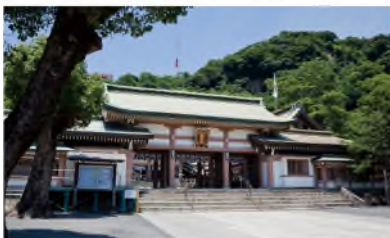
照国神社 徒歩 4 分(約 280m)

「サーパス照国表参道」が誕生する照国町周辺には、照国神社や鹿児島県歴史資料センター黎明館(鶴丸城跡)、鹿児島市立美術館など歴史・文化の施設が揃い、現代の洗練された都市づくりの中に築かれてきた歴史が息づいています。