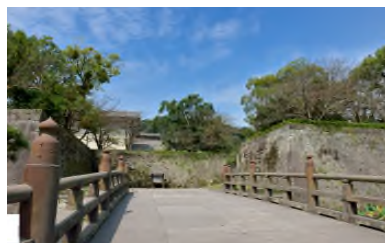
鹿児島県歴史資料センター黎明館 徒歩 10 分(約 790m)