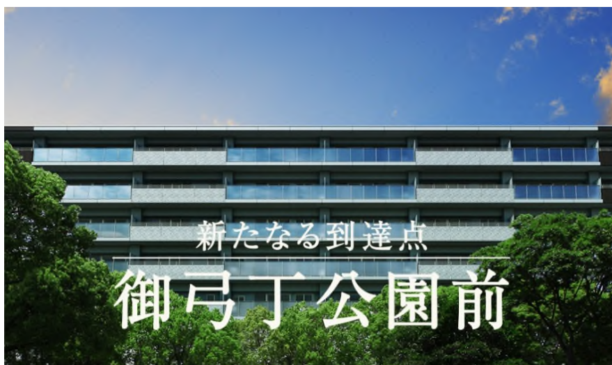
建物外観完成予想図

また、ショッピング・教育施設・銀行など日常生活に便利な施設が徒歩10分圏内に整った、周南市内でも恵まれた立地に位置しています。